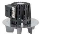
28 Rauchgasgebläsemotor • Passend für Eventura HVL 2.0 und HV • Mit Lüfterrad