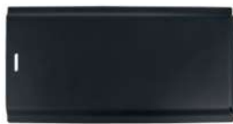
17 Füllraumschutzblech oben • Passend für Eventura HVL 2.0