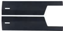
19 Füllraumschutzblech vorne rechts/links • Passend für Eventura HVL 2.0