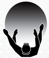
NIGHT VIEW HEADLAMP