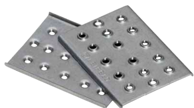
mit Gewinde - Fixierplättchen M5