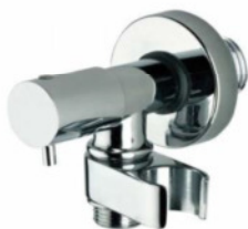
Immagine Prodotto - Product Image

Запорный кран на 1/2" M с керамическими дисками и поворотным держателем.