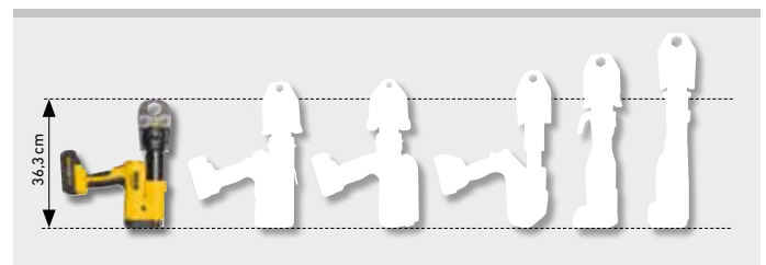
Die Kleine unter den Großen. Nur 3,3 kg.

Li-Ion 22 V Technology. Hochbelastbare Akkus Li-Ion 21,6 V mit 2,5, 4,4, 5,0 oder 9,0 Ah Kapazität, für lange Laufzeit. Leicht und leistungsstark. Akku Li-Ion 21,6 V, 2,5 Ah für ca. 210 Pressungen, 4,4 Ah für ca. 370 Pressungen, 5,0 Ah für ca. 420 Pressungen, 9,0 Ah für ca. 750 Pressungen. Siehe Profipress DN 15 mit einer Akkuladung*. Gestufte Ladezustandsanzeige mit farbigen LED. Arbeitstemperaturbereich - 10 bis + 60 °C. Kein Memoryeffekt für maximale Akkuleistung. Schnellladegerät 100 - 240 V, 90 W. Schnellladegerät 100 - 240 V, 290 W, für kürzere Ladezeiten, als Zubehör. Spannungsversorgung 220 - 240 V/21,6 V, 15 A, für Netzbetrieb anstelle Akku Li-Ion 21,6 V, als Zubehör.