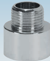
FIGURE / ABBILDUNG 530/OT

M/F CHROMIUM-PLATED REDUCED EXTENSION VERLÄNGERUNG REDUZIERT VERCHROMT M/F