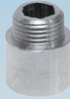
FIGURE / ABBILDUNG 529/OT

M/F CHROMIUM-PLATED HEAVY BRASS EXTENSION