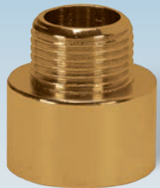
FIGURE / ABBILDUNG 530/OT