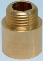
FIGURE / ABBILDUNG 529/OT