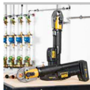
Tested by electrosuisse >>>