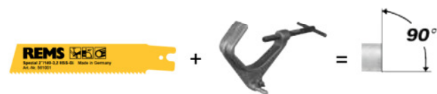
Tested by electrosuisse >>>