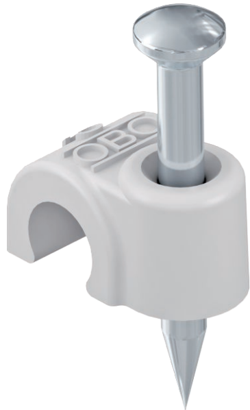
ISO-Nagel Clip, Kurze Bauform