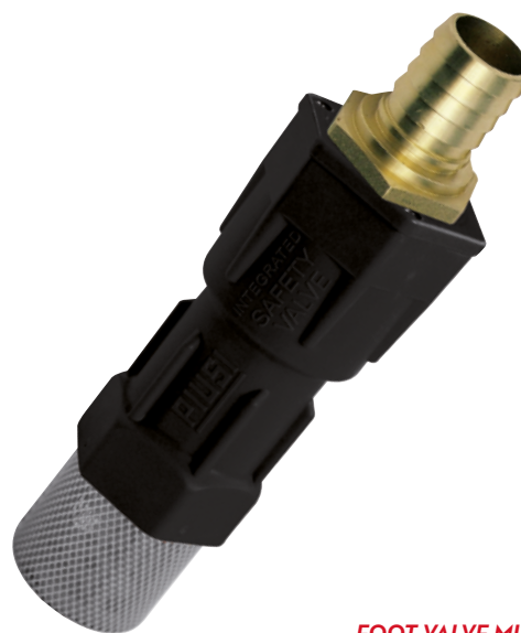
FOOT VALVE MIT FILTER