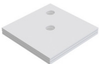
SA32226 SD U-BauEL für barr-frei DU Ablauf ACO 900x900x20/30/40