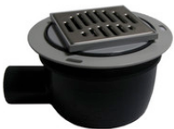
SA32102 SD Ablauf für PLAN ACO DN50 waagrecht, Nr. 48634