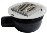
SA32104 SD Ablauf für PLAN ACO DN50 waagrecht (30 mm), Nr. 48633