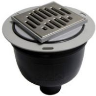
SA32100 SD Ablauf für PLAN ACO DN 50 senkrecht, Nr. 48635