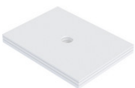
SA32287 SD U-BauEL für barr-frei DU Ablauf ACO 1200x900x20/30/40