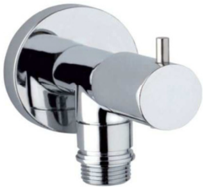
Immagine Prodotto - Product Image

Robinet d'arrêt avec tête à disques céramiques 1/2" M Llave de paso con cartucho de discos céramicos, de 1/2" M Запорный кран на 1/2" M с керамическими дисками