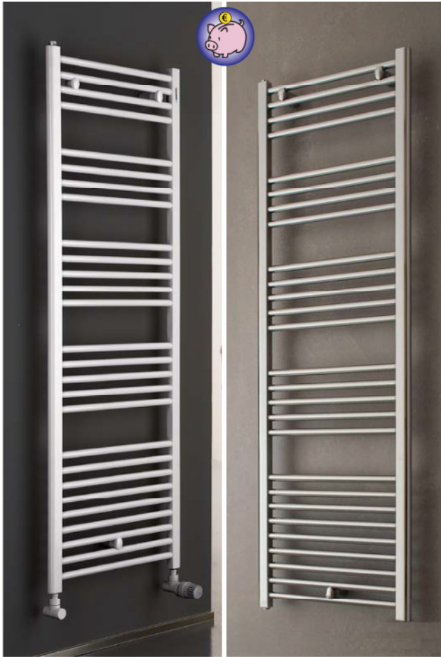
Données techniques et photos à titre indicatif. Robinetterie non fournie. Approximate images and technical details. Fittings not included.