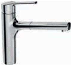
Hansaronda mit herausziehbarem Auslauf