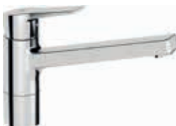
Hansatwist mit Flexschläuchen