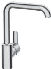
Hansaprimo seitliche Betätigung mit Flexschläuchen

Technik | • Eigensicher gegen Rückfließen