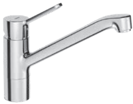
Hansaprimo mit Flexschläuchen