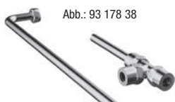
Abb.: 93 178 38