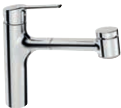
Hansaronda mit herausziehbarer Geschirrbrause

Technik | • Eigensicher gegen Rückfließen