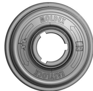
Rückseite 9030 mit den neuen Symbolen „Filter paarweise tauschen“ und „Benutzerinformation lesen!“