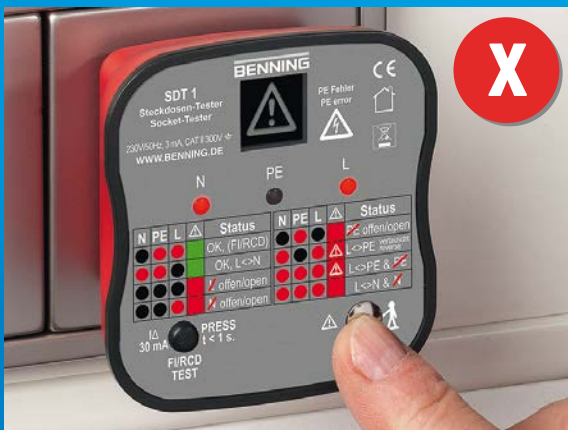
Steckdose mit Verdrahtungsfehler, Lebensgefahr! Außenleiter (L) und Schutzleiter (PE) wurden vertauscht!