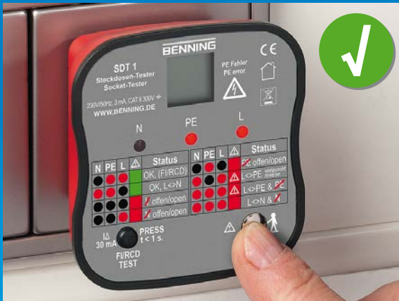
Steckdose korrekt installiert, Fingerkontakt prüft PE-Kontakt auf gefährliche Berührungsspannung.