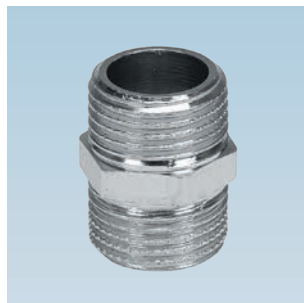
FIGURE / ABBILDUNG 280/OT CHROMIUM-PLATED M/M DOUBLE NIPPLE DOPPELNIPPEL M/M VERCHROMT