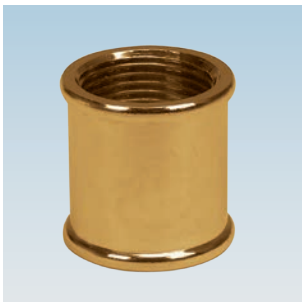
FIGURE / ABBILDUNG 270/OT F/F COUPLING MUFFE F/F