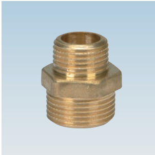
FIGURE / ABBILDUNG 245/OT M/M REDUCED NIPPLE NIPPEL M/M REDUZIERT