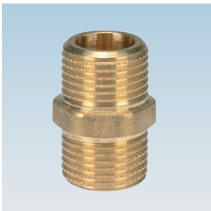
FIGURE / ABBILDUNG 281/OT HEAVY LONG THREADED M/M NIPPLE NIPPEL M/M LANGGEWINDE SCHWER