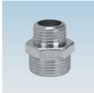
FIGURE / ABBILDUNG 245/OT CHROMIUM-PLATED M/M REDUCED NIPPLE NIPPEL M/M REDUZIERT VERCHROMT