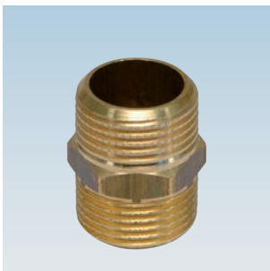
FIGURE / ABBILDUNG 280/OT M/M DOUBLE NIPPLE DOPPELNIPPEL M/M