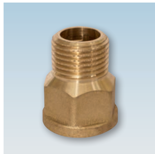
FIGURE / ABBILDUNG 271/OT HEAVY FITTING M/F SCHWER ANSCHLUSS AG/AG