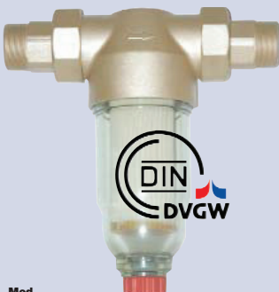
Mod. Bavaria N