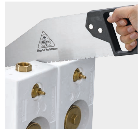
Trennung des Montageblocks (zum Singleblock) mit handelsüblicher Säge