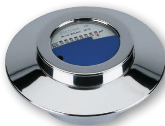
UP-Kompaktzähler für modulares Funkssystem (ECO)