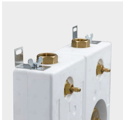
Befestigungsdarstellung inkl. Montagewinkel