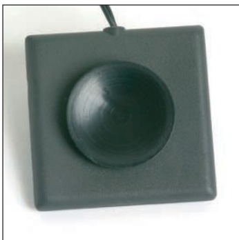
Saugknopf für die einfache Befestigung auf glatten Wänden.