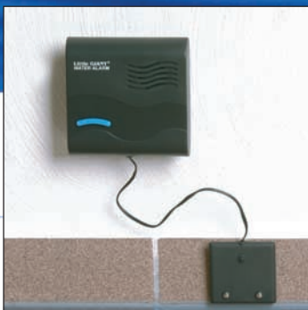
Mehrere Möglichkeiten zur Montage des Gebers.