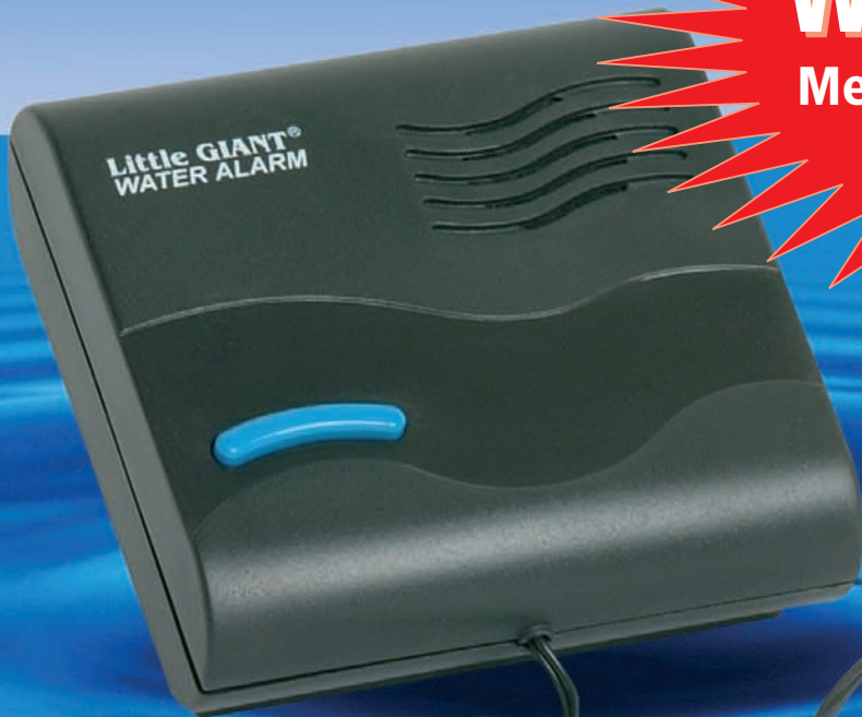
Art. Nr. LG 513350