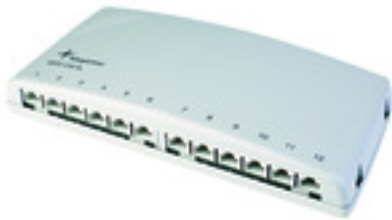
Abb. kann abweichen

Mini-Verteiler MPD12-HS K Cat.6 A , lichtgrau RAL 7035