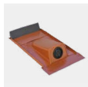
Passage de tuyau Type Argile avec passe-fils