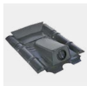
Passage de tuyau Type Béton avec passe-fils