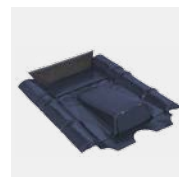
Passage de câble Type Béton