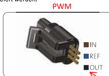
Abb. 11 Mini-Superseal-Stecker

Der Steuersignalanschluss verfügt über drei Leiter: Signaleingang, Signalausgang und Signalbezugspunkt. Siehe Abb. 11. Schließen Sie das Kabel mit einem Mini-Superseal-Stecker an den Schaltkasten an. Das Signalkabel kann als Zubehör mit der Pumpe geliefert werden.