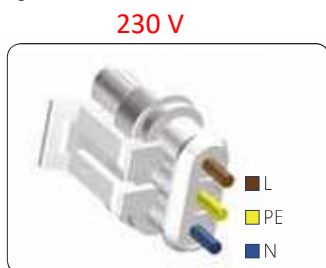
Abb. 10 Superseal-Stecker

Schließen Sie die Pumpe mithilfe des Superseal-Steckers an die Stromversorgung an.