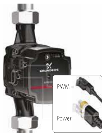
Abb. 9 Schaltkastenanschlüsse