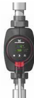
Abb. 12 Inbetriebnahme der Pumpe