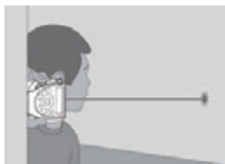
Quickly Ergo-eXpress Messung