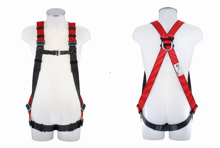
MAS 10 (EN 361) Vorderansicht