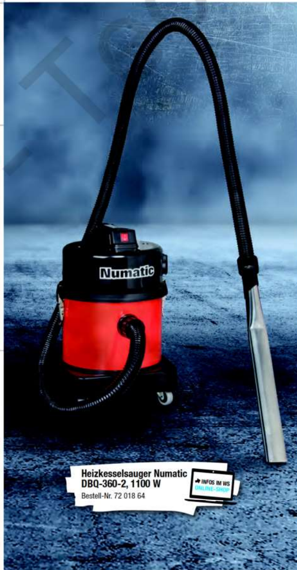
Heizkesselsauger Numatic DBQ-360-2, 1100 W