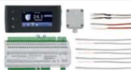
36 Komplettsset Igneo Touch I und HVL • Mit Sensoren und Big Modul