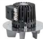
28 Rauchgasgebläsemotor • Passend für Eventura HVL 2.0 und HV • Mit Lüfterrad