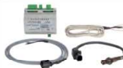
30 Lambdasonde • Passend für Eventura • Mit Modul HVL 2.0 PKL und PKKL