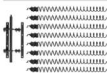
23 Reinigungsmechanismus • Passend für Eventura HVL 2.0 • Leistung: 25 und 30 kW