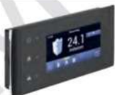
33 Touch Display • Passend für Eventura HVL 2.0 und HV