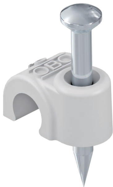
ISO-Nagel Clip, Kurze Bauform