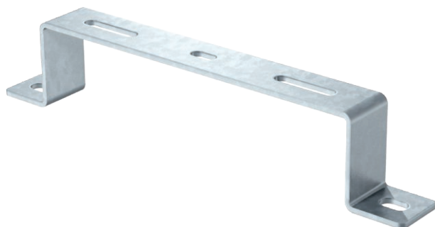
Distanzbügel für Kabel- und Gitterrinnen.