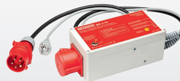
BENNING MA 2-16 (044160)