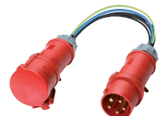
Messadapter (044127/044128) z.B. für CM 9-1