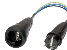
Messadapter (044131) z.B. für CM 9-1