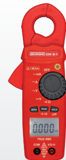
BENNING CM 9-1 (044682)