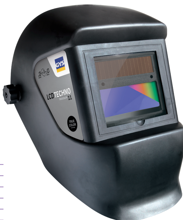
Lieferung mit Stirnband