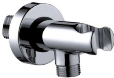
Immagine Prodotto - Product Image