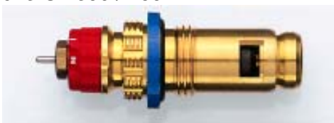
013 G 7482 seit 2001 Bezug nur über Heizkörperhersteller