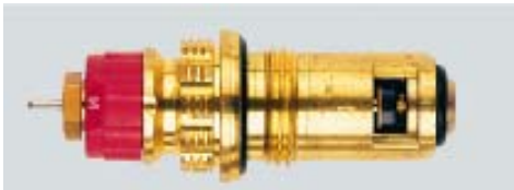
013 G 7390 / 1997 -