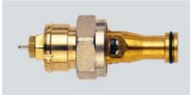
013 L 0215 / 1980 – 1989

Ersatz für 013L0215 ab 06.2006 Rote Voreinstellkrone / Codierung NJ Mit Reduzierstück 3/4" x 1/2" RA Fühleraufnahme