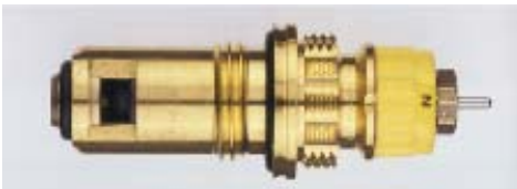
013 G 7391 / 1997 -