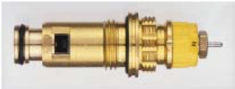
013 G 7371 / 1997 -