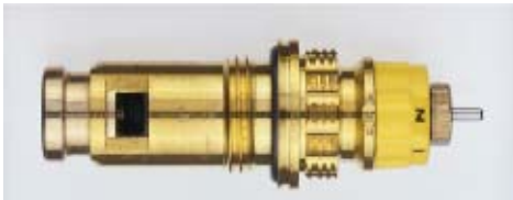
013 G 7381 / 1997 -