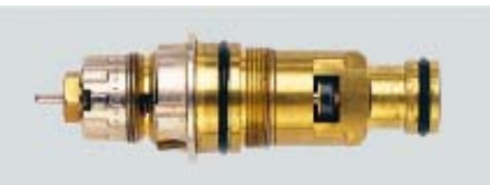
013 G 0270 / 1991 – 1997

Rote Voreinstellkrone, Montage mit 21mm Ringschlüssel Einschraubgewinde M22*1,0 Abstand der O-Ringe 43 mm