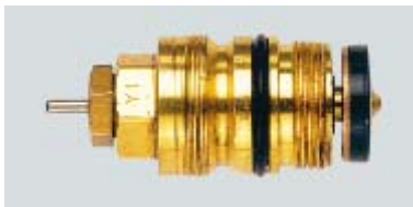
013 G 0245 (Flachkegel ab 1990) 013 G 0216 (konischer Kegel 1985-1990)

Montage mit 13mm Sechskant, Stopfbuchse 10mm