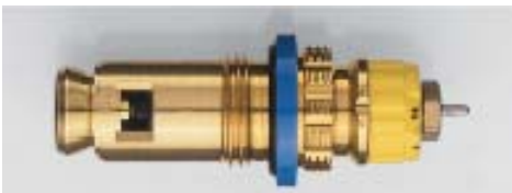
013 G 7483 seit 2001 Bezug nur über Heizkörperhersteller