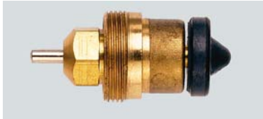
13 L 0219 / 1981 – 1986

Montage durch 3/4" Überwurfmutter, RAVL Fühleraufnahme