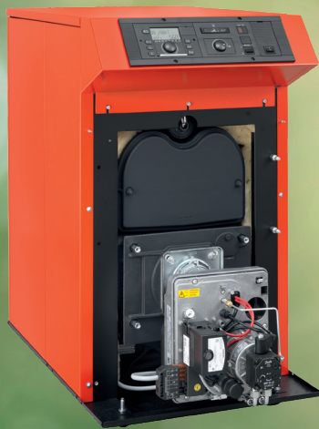
Abb. Ausf. Premium