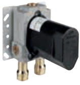
Grundkörper für Unterputz-Einhebelmischer