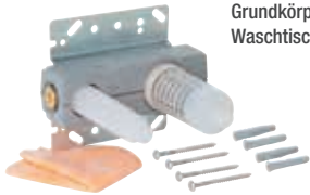
Grundkörper für Wand-Waschtischmischer