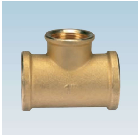
FIGURE / ABBILDUNG 131/OT