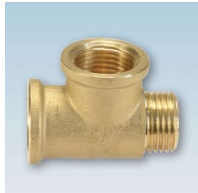
FIGURE / ABBILDUNG 134/OT