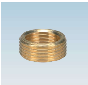
FIGURE / ABBILDUNG 239/OT