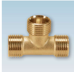
FIGURE / ABBILDUNG 132/OT