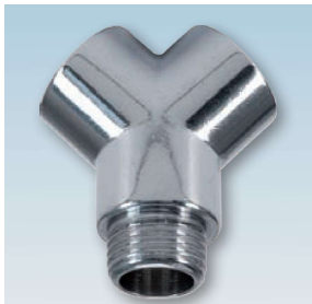
FIGURE / ABBILDUNG 138/OT