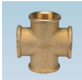
FIGURE / ABBILDUNG 180/OT