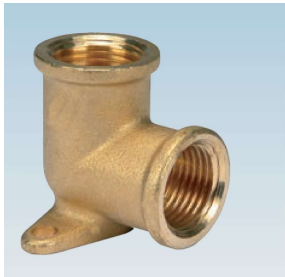
FIGURE / ABBILDUNG 133/OT