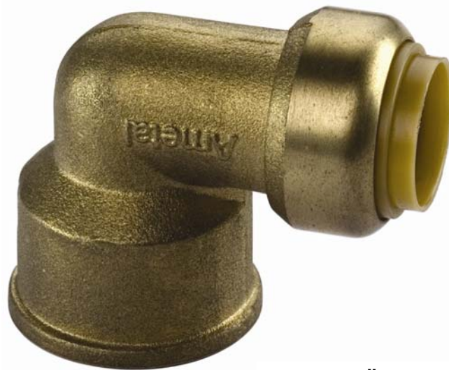
T 090 G, Übergangswinkel 90° I/IG (IG nach DIN EN 10226-1)