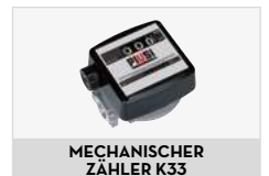
MECHANISCHER ZÄHLER K33