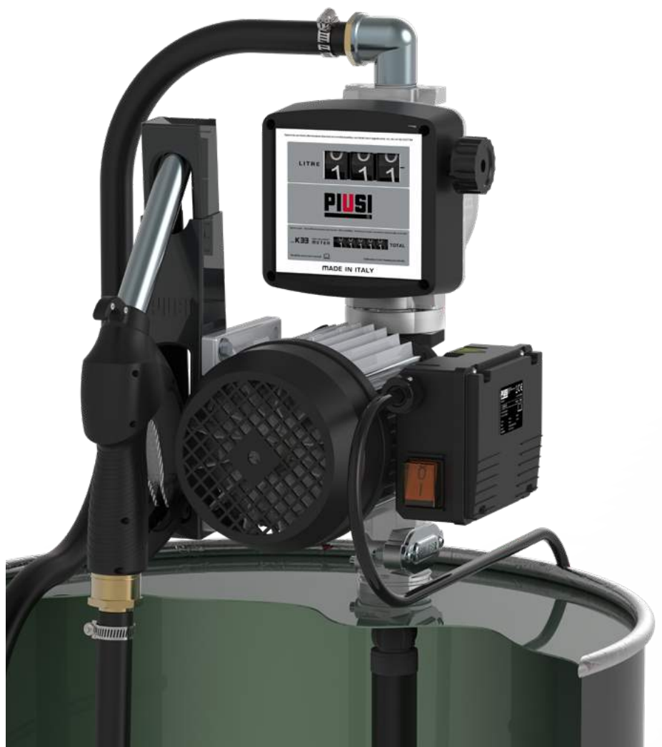
DRUM VISCOMAT VANE