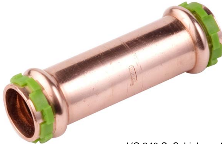
VC 240 S, Schiebemuffe ohne Anschlag