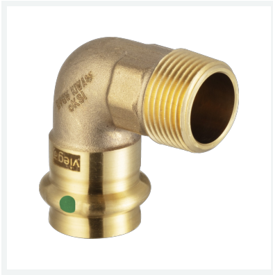
Sanpress-Übergangsbogen 90° mit SC-Contur Modell 2214 Artikel 281 205