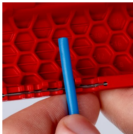
90 22 02 SB: Eingespritzte Längenskala für gleichmäßiges Abisolieren auf eine einheitliche Länge, lesbar für Rechts- und Linkshänder