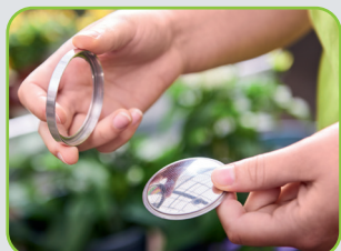
Platine leicht zu reinigen oder zu wechseln