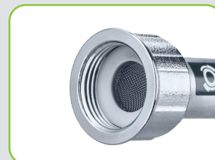
Eingelegter Schmutzfilter verhindert Ablagerungen

Produkte auf Karte finden Sie im Kapitel 4 „Stecksystem“