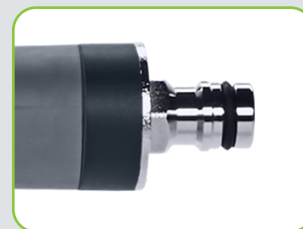
50.5409.9: mit GEKA® plus Steckanschluss