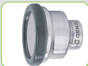
Schutzring aus Gummi zum Schutz vor Beschädigungen