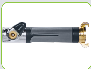
Handgriff mit Softgrip-Ummantelung