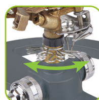
Beregnungssektor von 20° bis 360° einstellbar