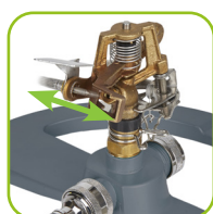
Regulierung von Zerstäubung und Bewässerungsfläche