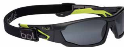
MERPSF + PSPUNISS01